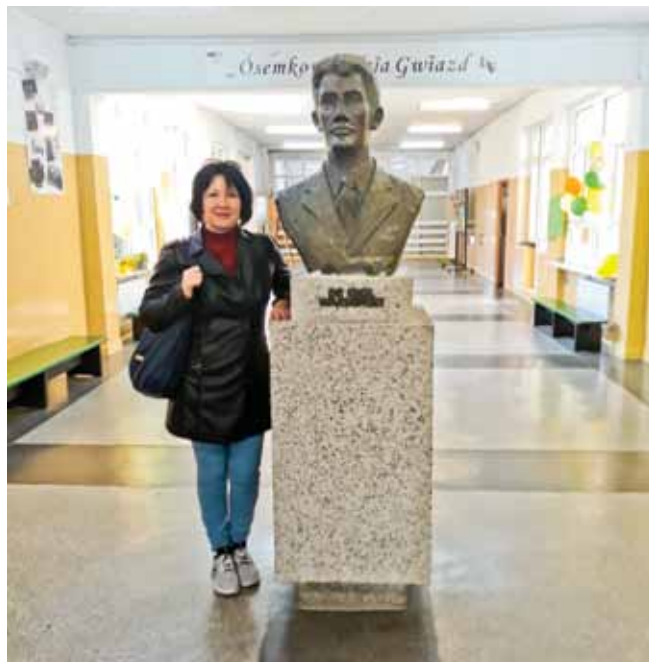
Popiersie wykonał bydgoski rzeźbiarz Marek Gucałski.

Zespół Szkół Medycznych w Bydgoszczy przy ul. Swarzewskiej 10 w dniu 12 grudnia 1986 r. nadano szkole imię Emila Warmińskiego oraz ustawiono p pierście patrona.